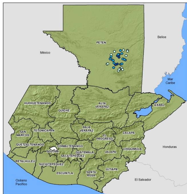
NIVEL DE DETONACIÓN DEL SEGURO POR LLUVIA